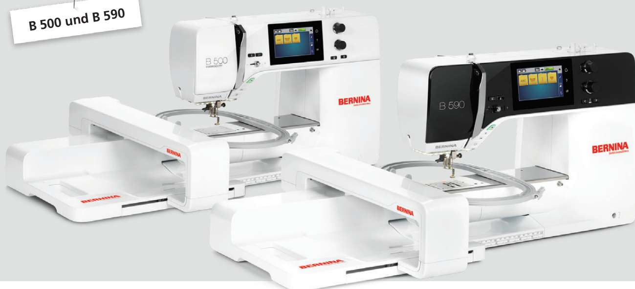
B 500 und B 590

Ganz einfach: alles. Ihre Schnelligkeit, damit alle Kostüme rechtzeitig fertig werden. Ihre Durchstichkraft, damit auch aussergewöhnlichste Materialien genäht werden können. Und ihre Stickfunktionen, für nahezu grenzenlose Kreativität. Daher ist diese Maschine genau die richtige Partnerin für Menschen, in deren Leben ausgefallene Ideen die Hauptrolle spielen.